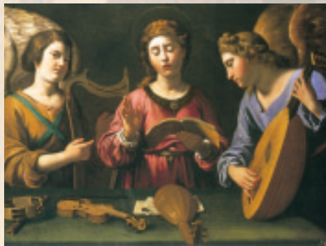
Antiveduto Grammatica 1570/71-1626 Santa Cecilia con due angeli Kunsthistorisches Museum Vienna